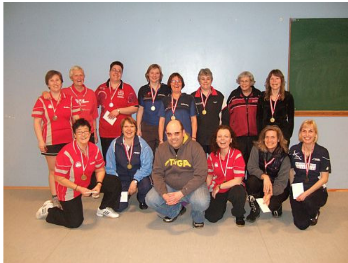
Glade damer fra sidste sæsons afslutning.

Derfor vil vi på opfordring prøve noget nyt, nemlig at starte sæsonen med to pointstævner for damer, så nu er der ingen undskyldning for ikke at komme godt i gang med sæsonen, og komme ud og spille mod damer fra andre klubber. Vi ved, at der er en del damespillere, som godt kunne tænke sig at komme ud og spille mod andre under hyggelige former, så her er det rette tilbud.